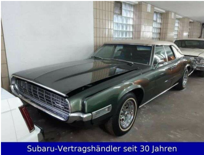
Subaru-Vertragshändler seit 30 Jahren