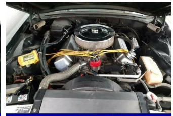
Subaru-Vertragshändler seit 30 Jahren