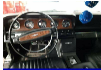
Subaru-Vertragshändler seit 30 Jahren