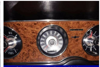
Subaru-Vertragshändler seit 30 Jahren